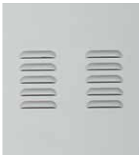
Grelhas de Ventilação