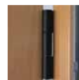
Dobradiça (portas revestidas PVC)